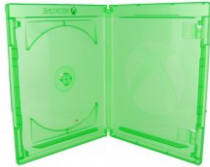
Boitier X BOX ONE vert clair dimensions 171 x 135 x 12,5 mm