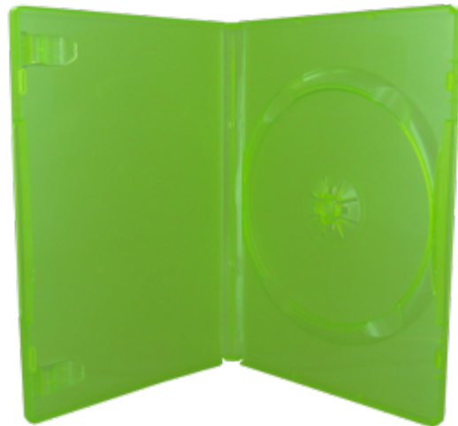
Boitier jeu X BOX 360 vert translucide dimensions 191 x 135 x 14 mm