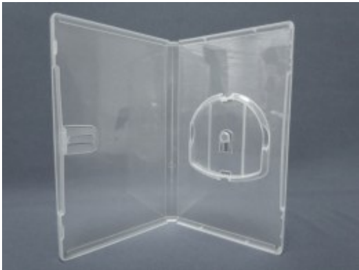
Boitier transparent compatible jeux PSP dimensions 177 x 105 x 15 mm