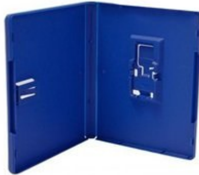
Boitier PS VITA bleu dimensions 133 x 104 x 10 mm