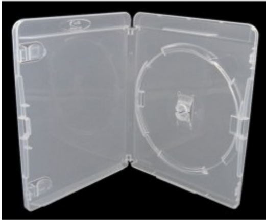
Boitier PS3 transparent avec logo, 1 blu-ray dimensions 171 x 135 x 15 mm