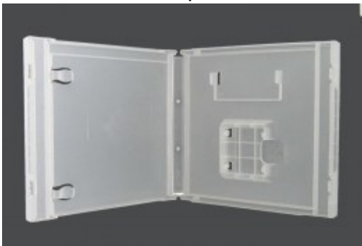
Boitier NINTENDO DS, transparent dimensions 136 x 123 x 19mm