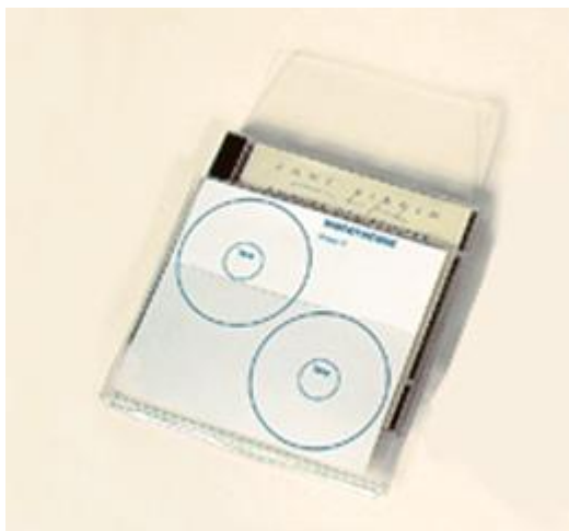
PVC 20/100 avec soufflet

Permet de protéger le CD dans son boîtier