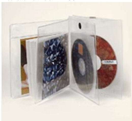
Pochette pour 1 CD avec rabat et velcro ref POMUR

Renforcée par PVC rigide. Dimensions de la pochette fermée : L 153 mm x H164 mm