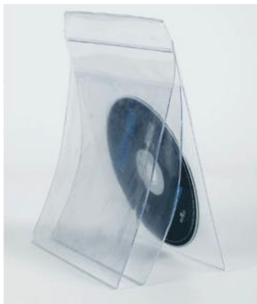
Pochette PVC 15/100 souple 3 volets pour 1 CD

Possibilité de rajouter des volets pour 2, 3 ou 4 CD (réf POMU2, 3, 4) Pour CD sans boîtier