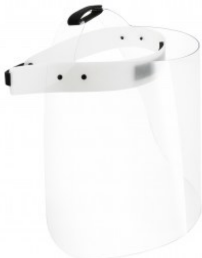
Visière de protection du visage

écran en Polyéthylène PETG transparent épaisseur 1 mm hauteur 23 cm couvrant tout le visage taille unique serre-tête réglable (tour de tête et hauteur) partie mousse de protection du front en partie avant livrée assemblée fabrication 100% française