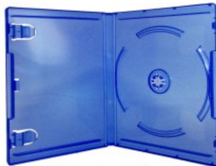
Boitier PS4-PS5 bleu clair dimensions 170 x 135 x 14 mm