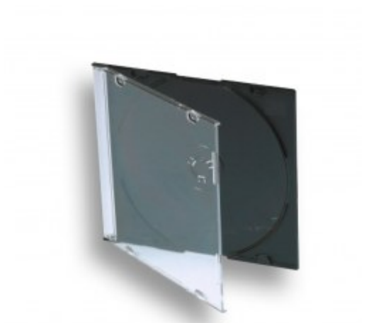
Boîtier cristal pour 1 CD